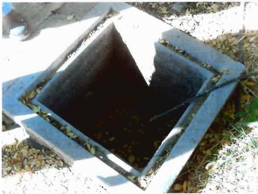
Foto 2.- Noria en desuso.

Foto 1.- Estanque acumulador de agua para riego de la cancha, seco y sin mantención.