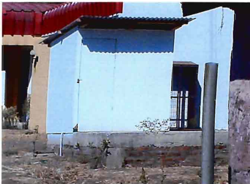
Foto 4.- Vista del estanque de acumulación de agua y la bomba, con puerta de estaque abierta.

Foto 3.- Los muros del estanque de acumulación, que alimenta de agua a los baños y camarines, se observa que se ejecutaron de ladrillo tipo pandereta, sobre la losa, se ubica la caseta en que se resguarda la bomba.